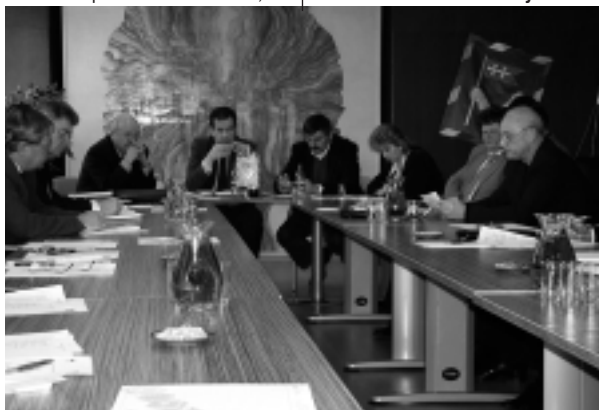
Vedenie mesta sa stretlo s významnými miestnymi podnikateľmi a investormi, aby ich oboznámilo s aktivitami nasledujúceho obdobia.