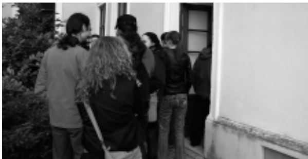
Otvorenie nového výstavného priestoru vyvolalo obrovskú vlnu záujmu medzi mladými návštevníkmi galérie.