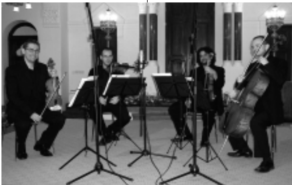
Na prvom koncerte sa predstavili členovia Presburger Quartet.