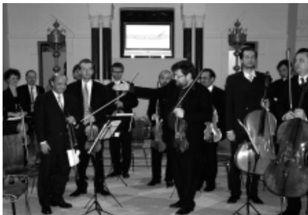
Na otvorení NHJ účinkoval komorný orchester Capella Istropolitana pod vedením R. Marečka.

né hudby milovné publikum vybrali dva kusy z tvorby E. Suchoňa, potom Jar z populárnych Štyroch ročných období A. Vivaldiho a vrcholom večera bol podľa nás Oktet M. Brucha. Ide pravdepodobne o jeho poslednú skladbu. E. Suchoňa sme zaradili nielen z dôvodu nedežitej storočnice, no aj preto, že jeho hudba má punc oso-