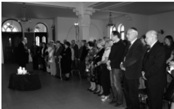
Na deportácie do táborov smrti spolu s Nitranmi spomínal aj veľvyslanec Izraelu Zeev Boker (druhý sprava).